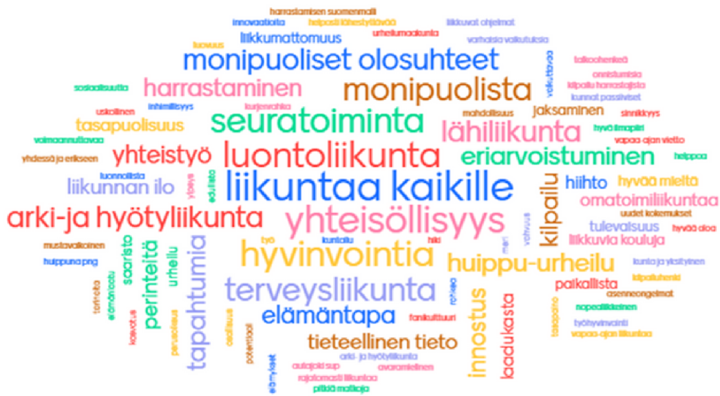
Kuvio 1: Varsinaissuomalaisen liikunnan keskeisiä arvoja sisältöjä. Mentimeter-kooste 29.3. tilaisuuteen osallistuneiden vastauksista.